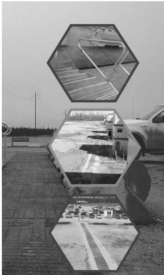
Рисунок 5 – Пішохідні доріжки з відпрацьованої гуми [7]

Мати OverlapMats призначені для забезпечення тимчасового або постійного покриття. Основна частина мату посилена за допомогою несучого елемента, який забезпечує підвищену міцність. Виріб стійкий до руйнування в нормальному режимі експлуатації під всіма видами транспорту.