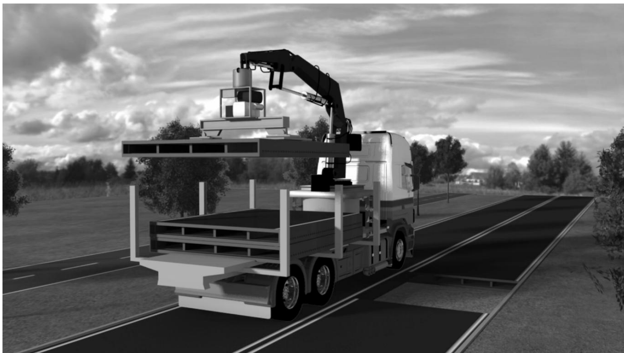
Рисунок 1 – Укладання Plastic Road [3]

VolkerWessels при будівництві доріг планує використовувати окремі порожні блоки, відлиті з перероблених пластикових відходів (рис. 1).