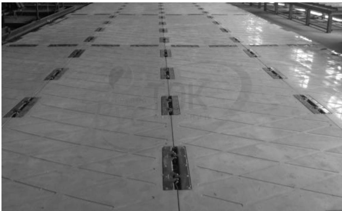
Рисунок 2 – Застосування модульних дорожніх покриттів МДП Р-ПЕК [4]

В якості полімерних виробів відомі також модульні дорожні покриття (МДП Р-ПЕК) багаторазового використання, які виготовляють у вигляді плит з встановленими на них замковими пристроями, які дозволяють монтувати тимчасові дороги і майданчики будь-яких розмірів [4].