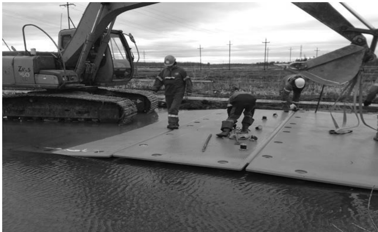
Рисунок 3 – Мобільне дорожнє покриття "МОБІСТЕК" [5]

Полімерні дорожні плити [6] - застосовують для створення покриття автомобільних доріг різної прохідності з метою забезпечення безпечного руху транспортних засобів протягом тривалого часу. Вони представляють собою елементи функціонально пов'язаних штучних інженерних споруд. Полімерні дорожні плити монолітні або збірні можуть бути різних розмірів і конфігурації. Поверхня плит, яка контактує з колесами транспортних засобів має необхідне зчеплення, пружність та опірність до стирання. Такі дорожні плити є універсальними конструкціями дорожнього одягу та дозволяють в мінімальні терміни створювати дороги, що підходять для руху різних видів транспорту, у тому числі і важкої техніки. Їх можна використовувати у складних кліматичних