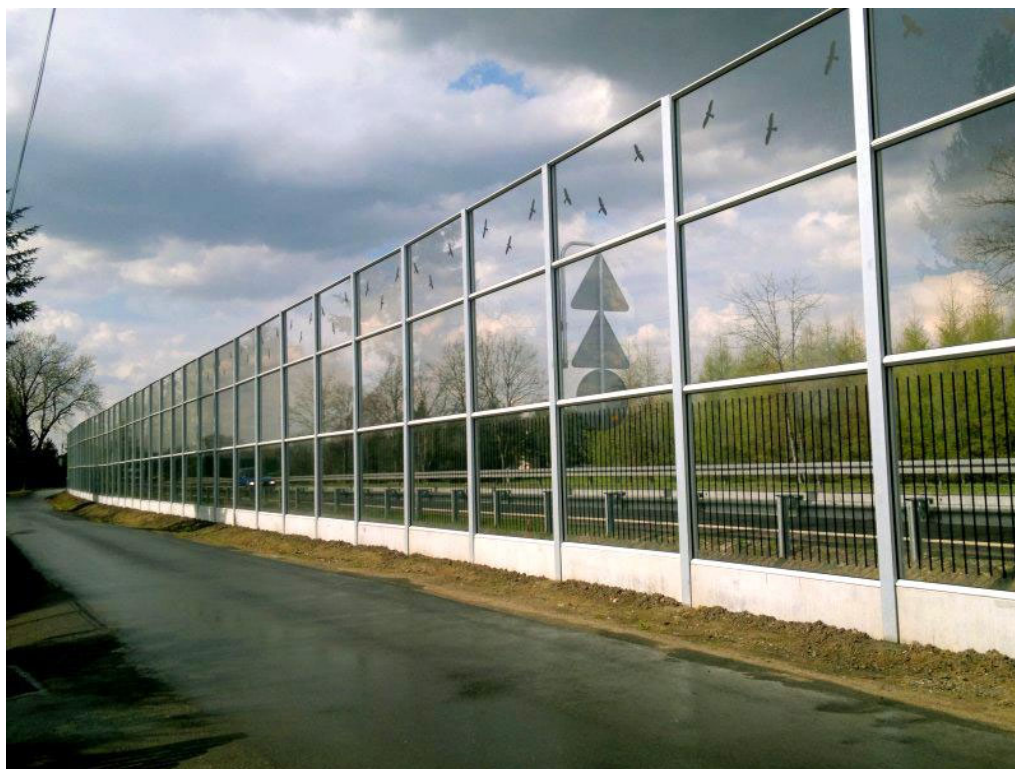
Рисунок - 1 Шумозахисний екран з плексигласу.

4. Міцність та стійкість: Плексиглас має високу міцність і стійкість до ударів, що робить його відмінним вибором для захисних бар'єрів на дорогах. Він стійкий до розривів і легше витримує зовнішні впливи, такі як погодні умови, що забезпечує довговічність матеріалу.