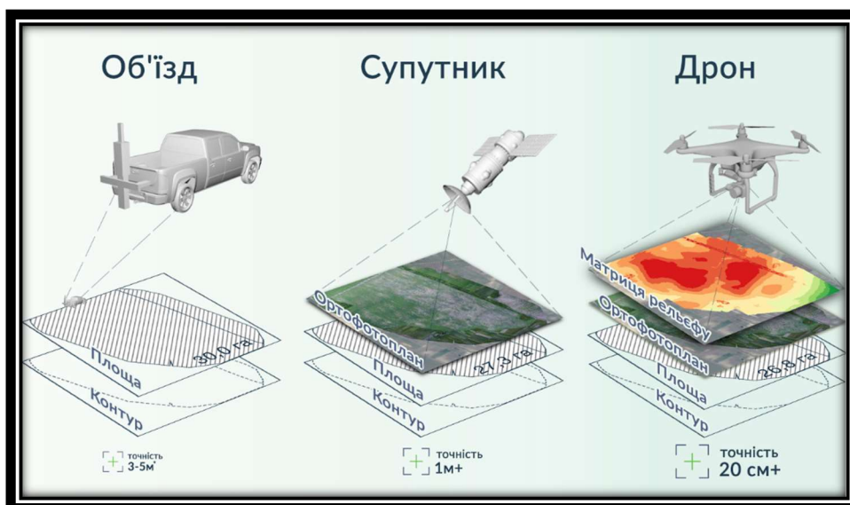
Рисунок 1 – Основні методи визначення площ полів у сільському господарстві Figure 1 – Basic methods of determining the area of fields in agriculture

В табл. 1 наведені переваги та недоліки кожного методу .