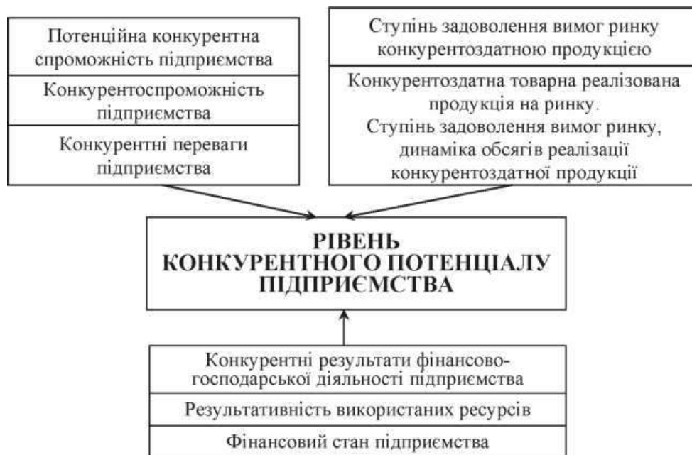
Рисунок 1 – Показники визначення рівня конкурентного потенціалу підприємства

Таким чином, вирішення визначених завдань економічного управління конкурентним потенціалом підприємства автотранспорту сприятиме забезпеченню його економічного розвитку в умовах наростаючої конкуренції та невизначеності зовнішнього середовища шляхом формування ефективних заходів протидії його негативним проявам шляхом розроблення методичних підходів, що дадуть змогу оперативним чином здійснювати оцінювання впливу наслідків прийнятих управлінських рішень на економічні результати діяльності підприємства та сприятимуть найбільш повному освоєнню потенційних та реальних можливостей підприємства автотранспорту в конкурентному середовищі (рис.1).