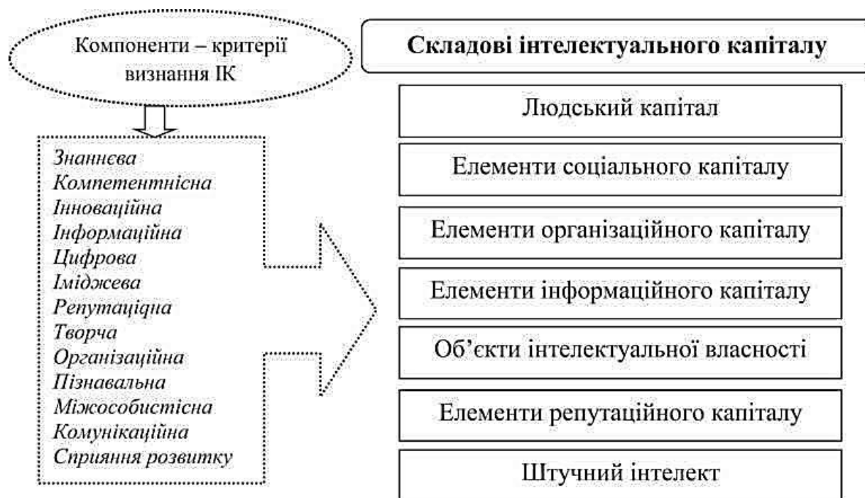
Рисунок 1 – Структурна модель інтелектуального капіталу підприємства