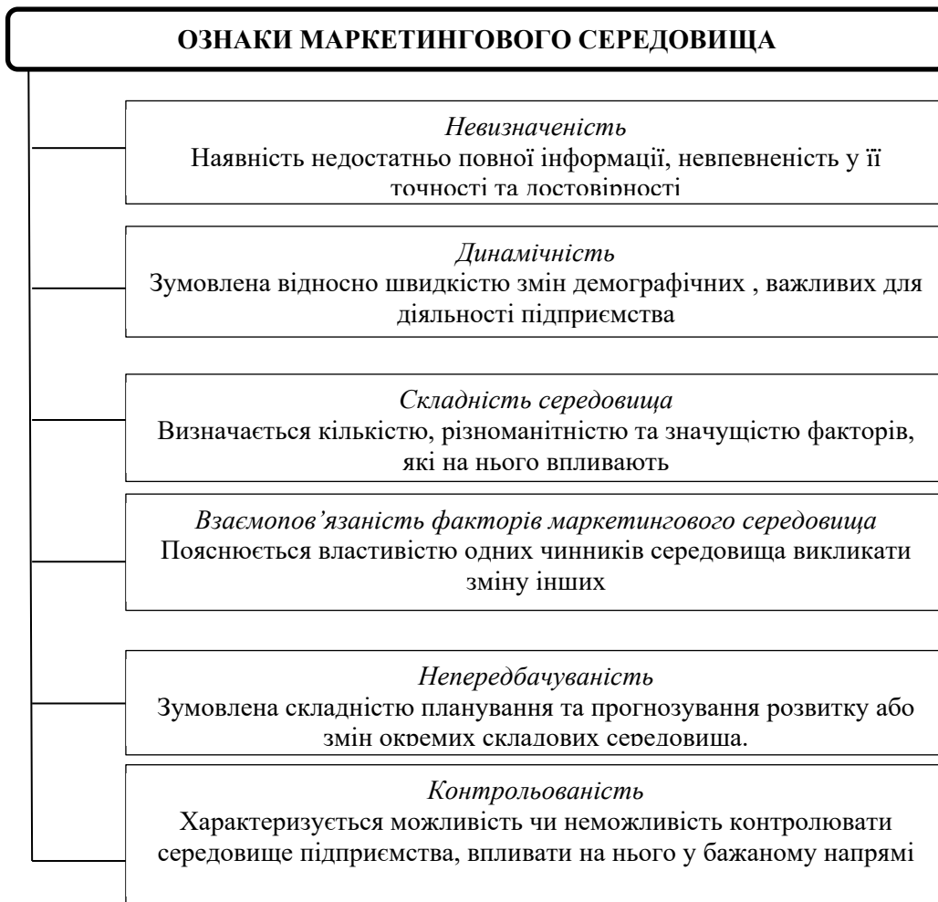
Рисунок 1 - Ознаки маркетингового середовища

Враховуючи політичні, економічні, демографічні умови країни та тенденції споживчого ринку, як в цілому, так і для окремих товарних груп, маркетингове середовище є невизначеним, динамічним і непередбачуваним у деяких сферах. Крім того, існує така особливість, як комплексність маркетингового середовища (рис. 1) [1].