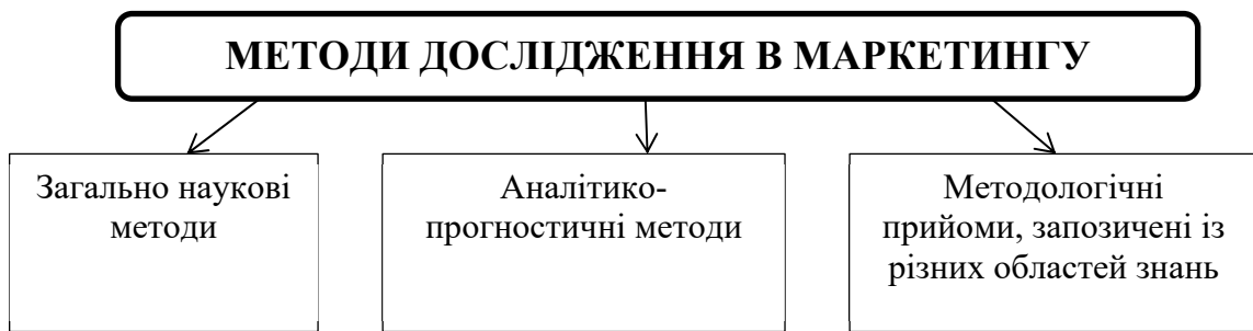
Рисунок 3 – Система методів дослідження маркетингової діяльності підприємства

На основі бізнес-моделей і формулювання політики вони поділяються на децентралізовані, централізовані та зустрічні. Децентралізована (розроблена «знизу») складається з окремих систем, розроблених корпоративними підрозділами, потім затверджених керівництвом і зведених в єдиний корпоративний бізнес-процес. Централізовані, або «зверху вниз», програми — це системи, коли весь бізнес-процес і окремі його компоненти складаються менеджерами компанії на основі даних аналітичних відділів. Третій, контрфактичний ринковий механізм, відрізняється від перших двох тим, що поєднання централізованих і децентралізованих механізмів створює ринок політики на основі змагального підходу. Менеджери встановлюють загальні цілі та напрямки діяльності, а співробітники розробляють плани реалізації.