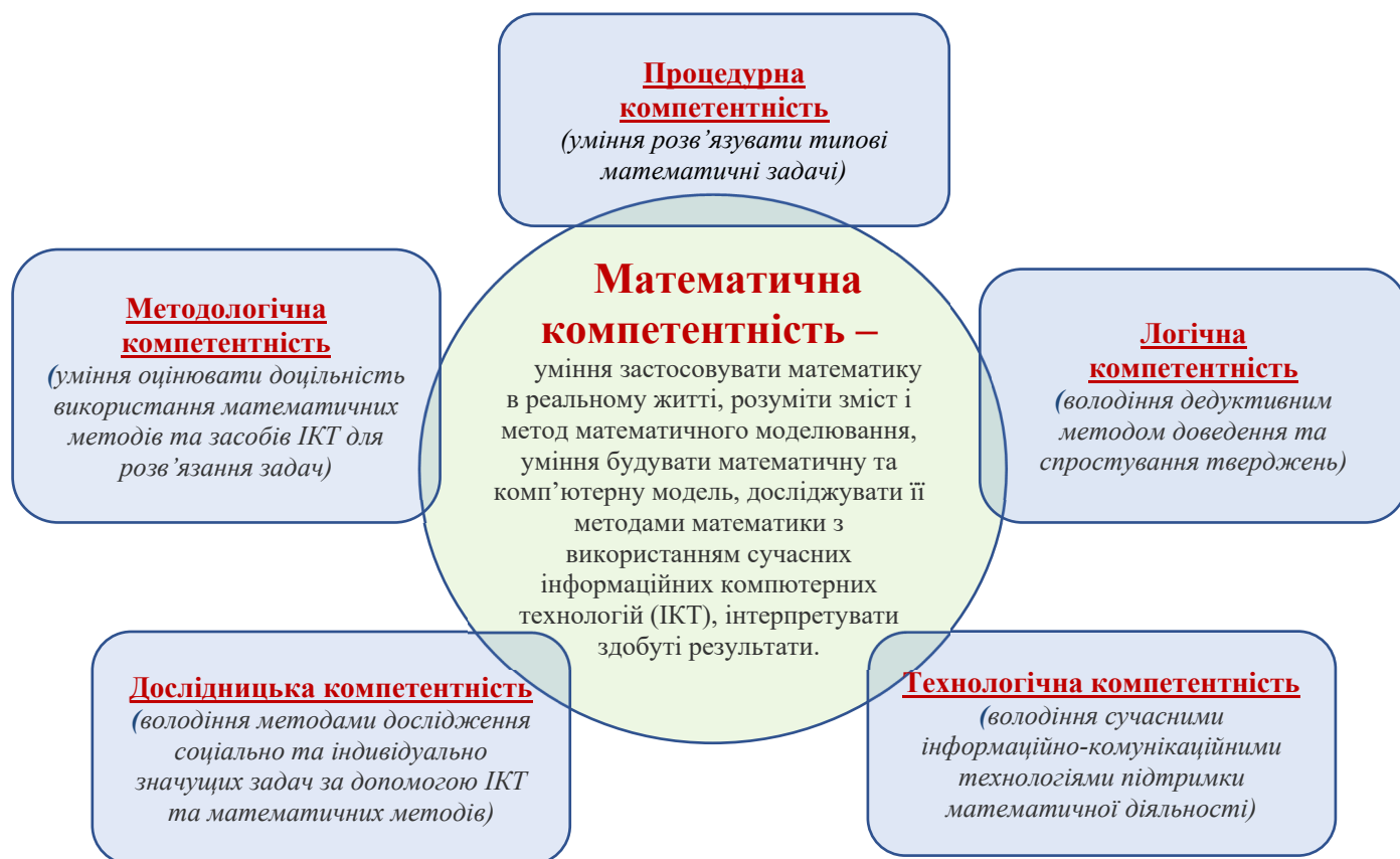
Рисунок 1 – Складові математичної компетентності Figure 1 – Components of mathematical competence

[7]. Підготовка студентів до застосування математичної теорії для моделювання технічних процесів, передбачає створення нового: нової технології, нового механізму, нових методів і ін. Слід відзначити, що технічна документація, з якою будуть працювати майбутні інженери, за своєю структурою близька до математичного матеріалу. Їх об'єднують стислість, формалізованість, наявність математичної обробки даних та інші параметри. А отже, методи математичного моделювання повинні забезпечувати студенту вміння їх застосовувати в професійних дисциплінах.