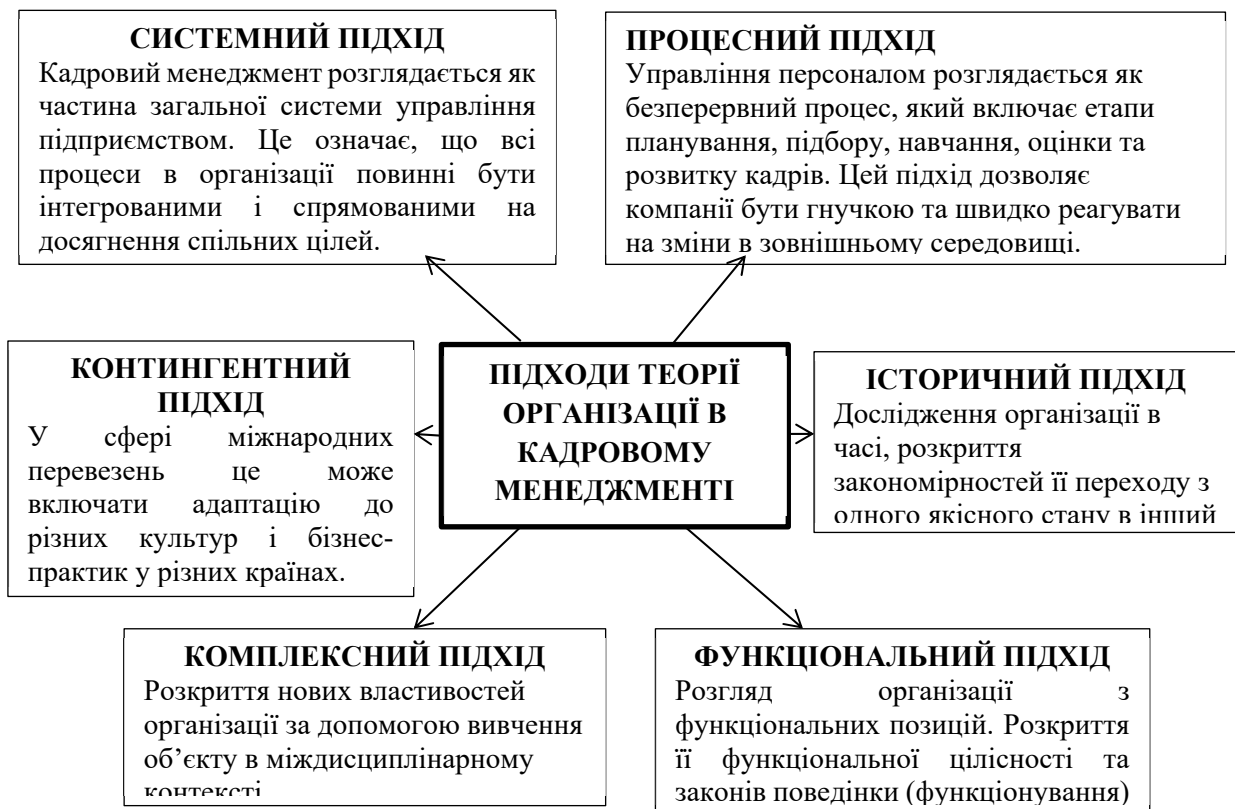
Рисунок 1 – Підходи теорії організації в кадровому менеджменті Figure 1 – Organizational theory approaches in human resource management

Теорія організації в кадровому менеджменті відіграє вирішальну роль. Кадровий менеджмент розглядається як частина загальної системи управління підприємством. Це означає, що всі процеси в організації повинні бути інтегрованими і спрямованими на досягнення спільних цілей. У контексті міжнародного транспорту це включає координацію роботи різних підрозділів, таких як логістика, обслуговування клієнтів та маркетинг. Вибір методів управління персоналом залежить від специфіки підприємства та зовнішніх умов. У міжнародному транспорті це може включати адаптацію до різних культур і бізнес-практик у різних країнах, що є важливим для формування ефективної команди. Головні підходи представлено на рис 1.