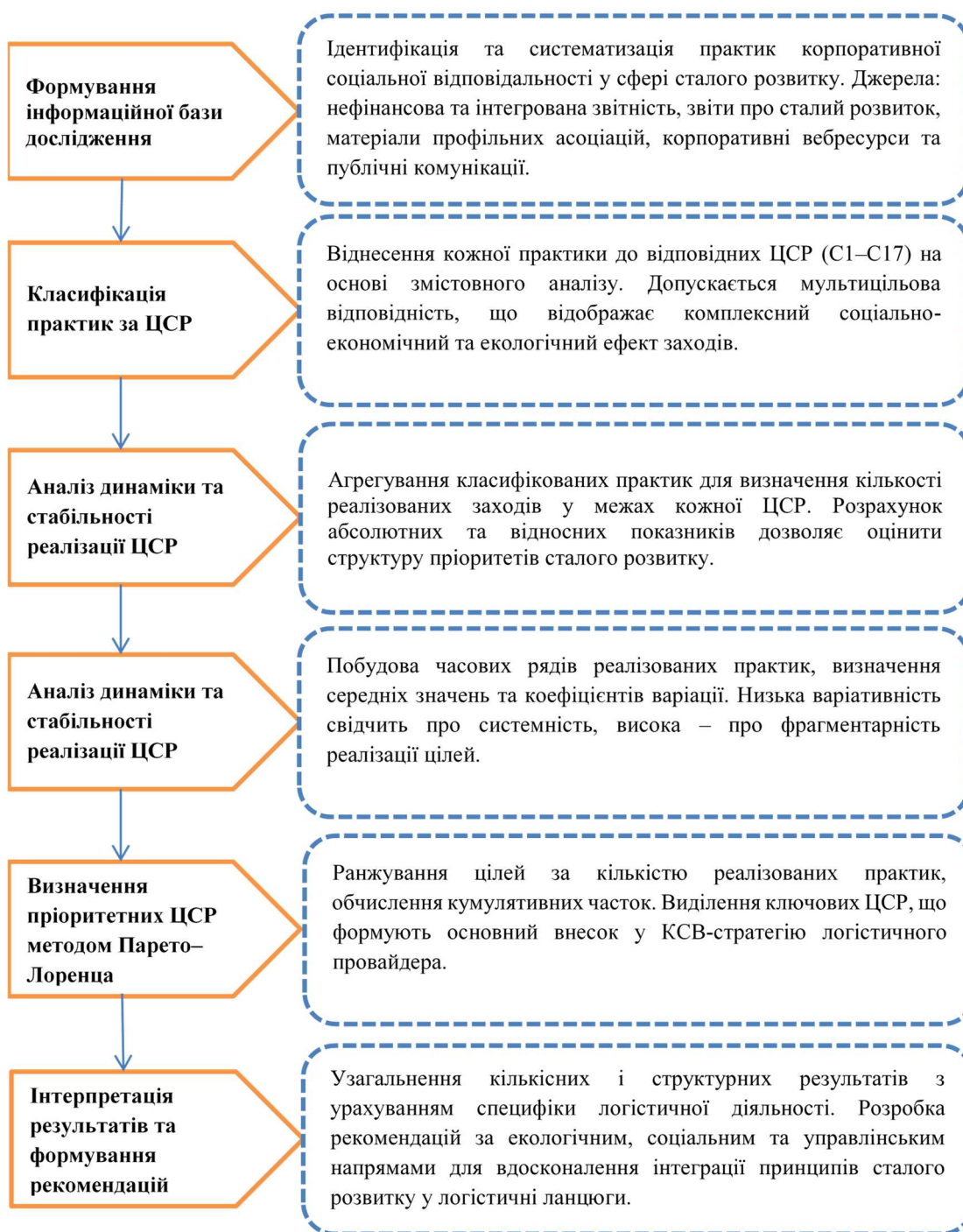
Рисунок 2 – Структурно-логічна схема методики аналізу реалізації КСВ логістичних провайдерів