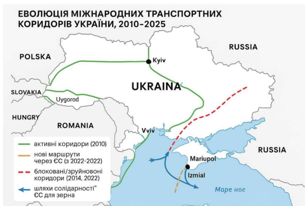
Рисунок 3 – Еволюція міжнародних транспортних коридорів України, 2010-2025 Figure 3 – Evolution of international transport corridors in Ukraine, 2010-2025