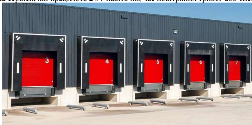
Рисунок 2 – Smart-рампи - рішення, яке поєднує в собі розумні технології та логістичні процеси для оптимізації руху товарів у логістичних комплексах