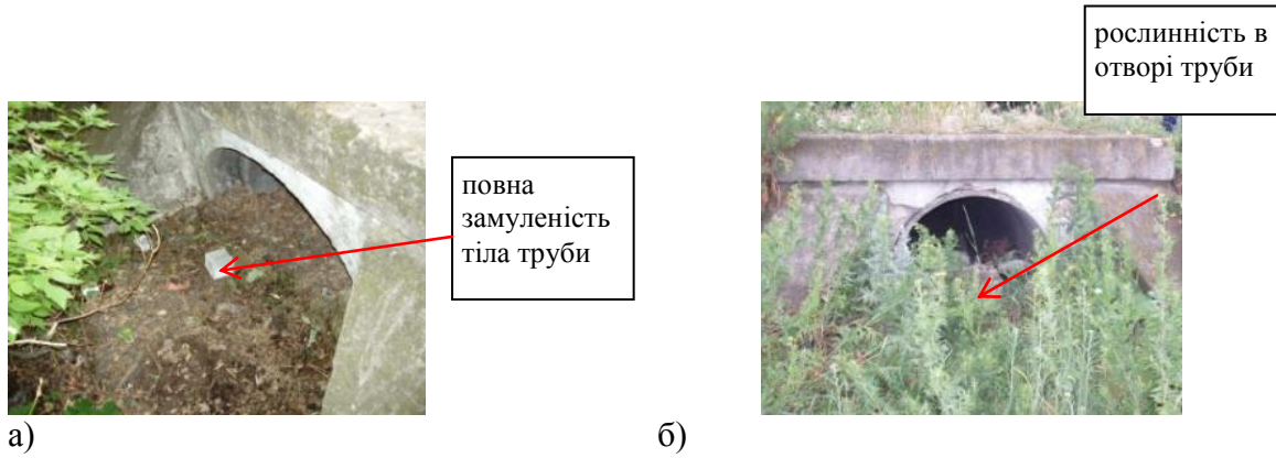
Рис. 4. Труба залізобетонна №25 ПК 53+130: вхідний (а) і вихідний (б) оголовки