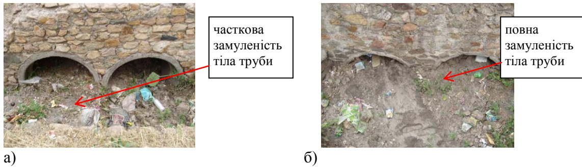
Рис. 5. Труба залізобетонна №13 ПК 33+370: вхідний (а) і вихідний (б) оголовки