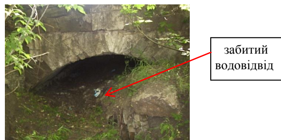
Рис. 1. Труба залізобетонна №51, ПК95+360

На дорозі Т-08-15 було виконані планові обстеження технічного стану водопропускних труб за вимогами паспортизації ділянки дороги. За результатами обстеження була проведена оцінка технічного стану малих штучних споруд та встановлено технічний стан труб згідно вимогам ДБН [2]. Оцінка технічного стану передбачає наявність чотирьох станів. Нормальний стан – труба відповідає вимогам проекту та чинним нормам. Задовільний – труба в цілому придатна до експлуатації, але потребує деякого ремонту. Аварійний – пошкодження конструкцій або елементів труби, через які відбувається припинення експлуатації. Згідно з методикою оцінки за категоріями пошкоджень і дефектів було визначено, що сім труб знаходяться у доброму стані, а інші – 49 у задовільному, 12 труб мають незадовільний стан з наступними пошкодженнями: руйнуванням кам'яних відкритків, ланок труби, укріплень відкосів земляного полотна, забитими відводами, тріщинами, повною чи частковою замуленістю (рис. 1-12).