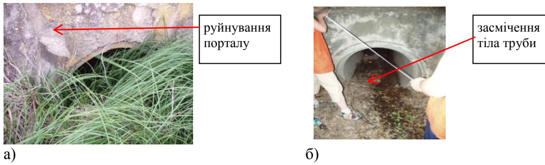
Рис. 3. Труба залізобетонна №23 ПК 49+820: вхідний (а) і вихідний (б) оголовки