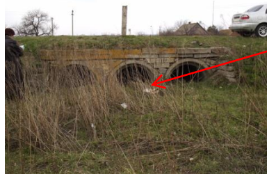
Рис. 9. Труба залізобетонна №6 ПК 11+848: вхідний (а) і вихідний (б) оголовки

часткова замуленість тіла труби, руйнування кам'яних відкритків