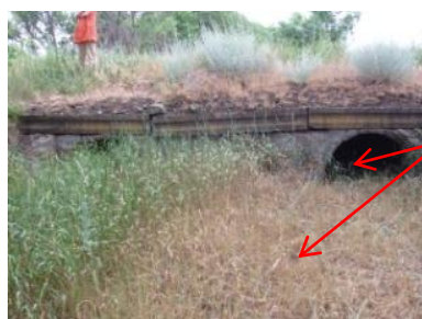
Рис. 11. Труба залізобетонна №12, ПК31+400

повна замуленість тіла труби, наносний ґрунт та рослинність перед оголовками