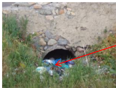
Рис. 7. Труба залізобетонна №14 ПК 33+840: вхідний (а) і вихідний (б) оголовки

Наявність сміття, ґрунту та зайвої рослинності перед вхідним оголовком