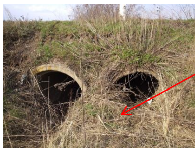
Рис. 8. Труба залізобетонна №18 ПК 41+200: вхідний (а) і вихідний (б) оголовки

повна замуленість вхідного оголовка труби