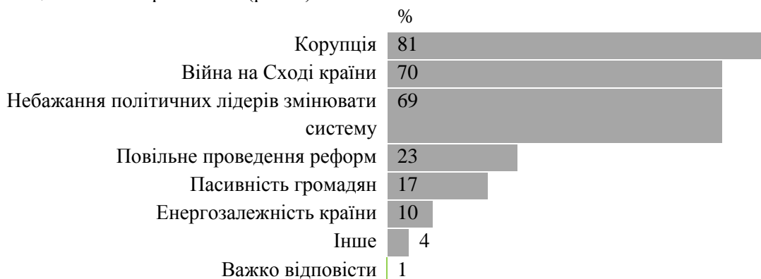
Рисунок 2 – Основні перешкоди розвитку економіки України

Як видно з рис. 1, Україна має дуже низьку оцінку стану корупції в країні. У 2016 році індекс некорумпованості мав позначку 29, що є кращим результатом у порівнянні з попереднім роком, де індекс був 27. Це означає, що Україна має високий рівень корупції, проте найкращий результат за останні вісім років. Динаміка індексу також показує, що радикальних реформ в країні не відбувалось, про що говорить відносно стала лінія індексів протягом 2008–2016 рр. Сьогодні корупція є загальнонаціональною проблемою (рис. 2).