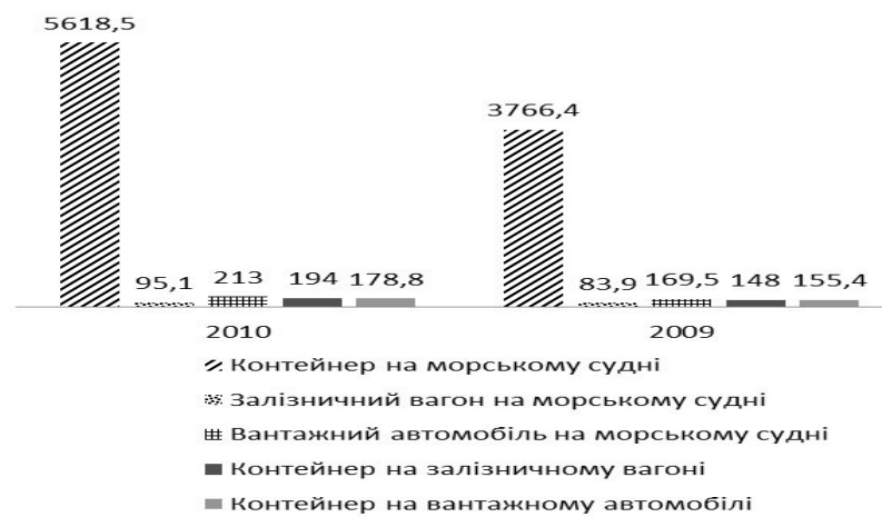
Рис. 3. Обсяги українського імпорту за різними видами транспортування в 2009-2010 роках, млн. дол. США

З іншого боку, варто зазначити, що такі перевезення у загальній структурі імпорту та експорту складають лише 5,17% та 10,37% від загального обсягу перевезень всіма видами транспорту, що приблизно дорівнює аналогічним показникам 2009 року (5,26% та 9,52%) [5]. Ці дані є досить низькими у порівнянні з країнами ЄС, проте вони відображають специфічну ситуацію в Україні. Нажаль, в сучасних ринкових умовах мультимодальний транспорт є дорожчим за унімодальний, що обумовлює менший попит на такі перевезення.