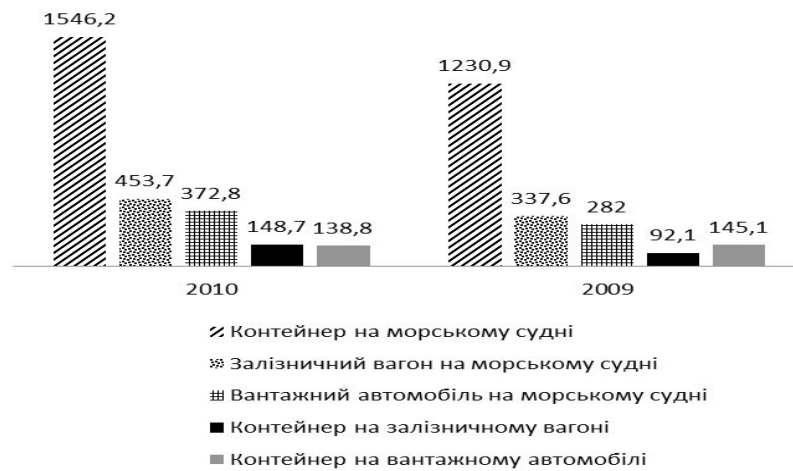
Рис. 2. Обсяги українського експорту за різними видами транспортування в 2009-2010 роках, млн. дол. США