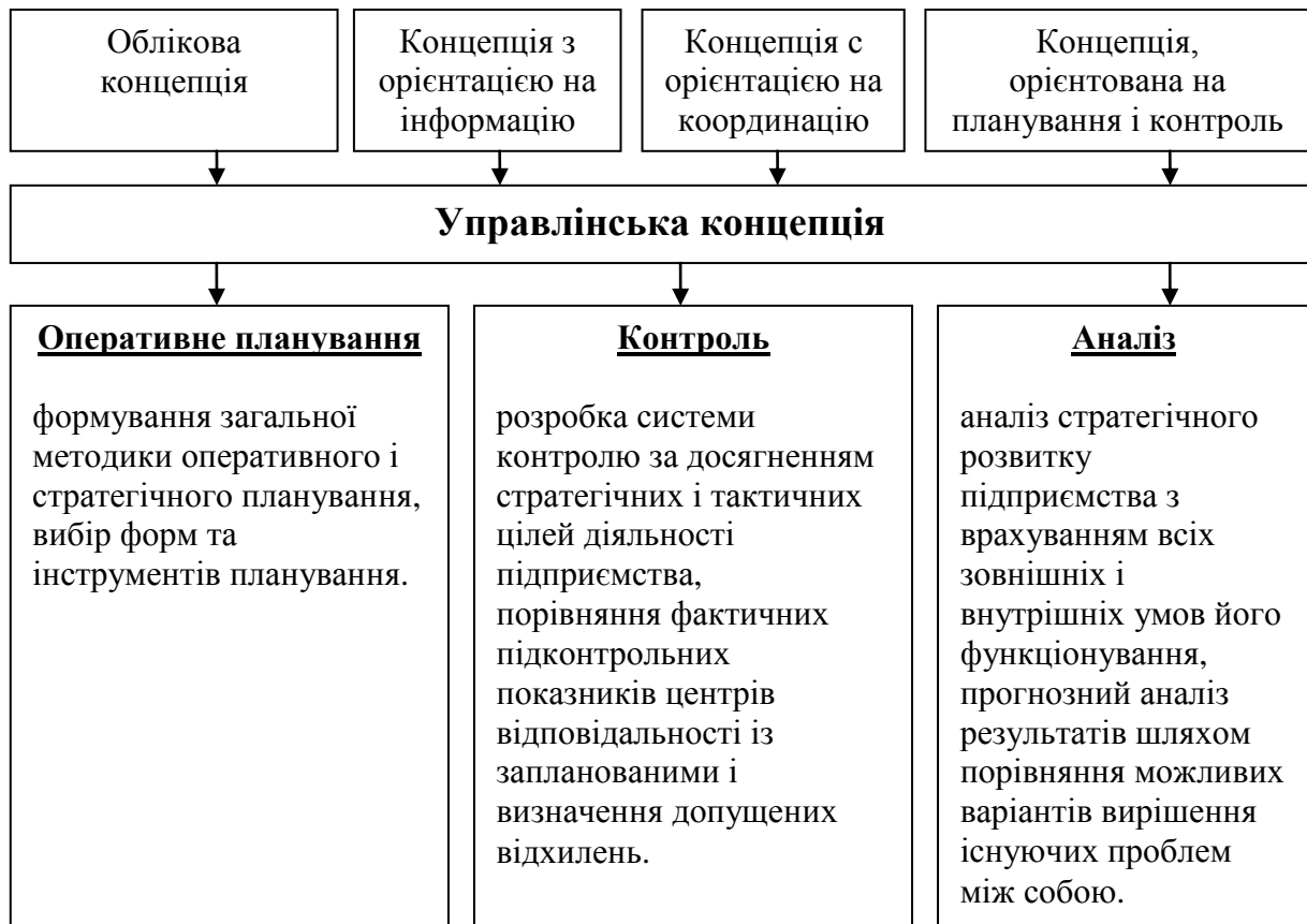
Рисунок 2. – Зміст і задачі контролінга

Логістична система сприяє створенню ефективного управління організацією, яке має деякі характерні риси незалежно від масштабів проблеми або керованого процесу, зокрема: