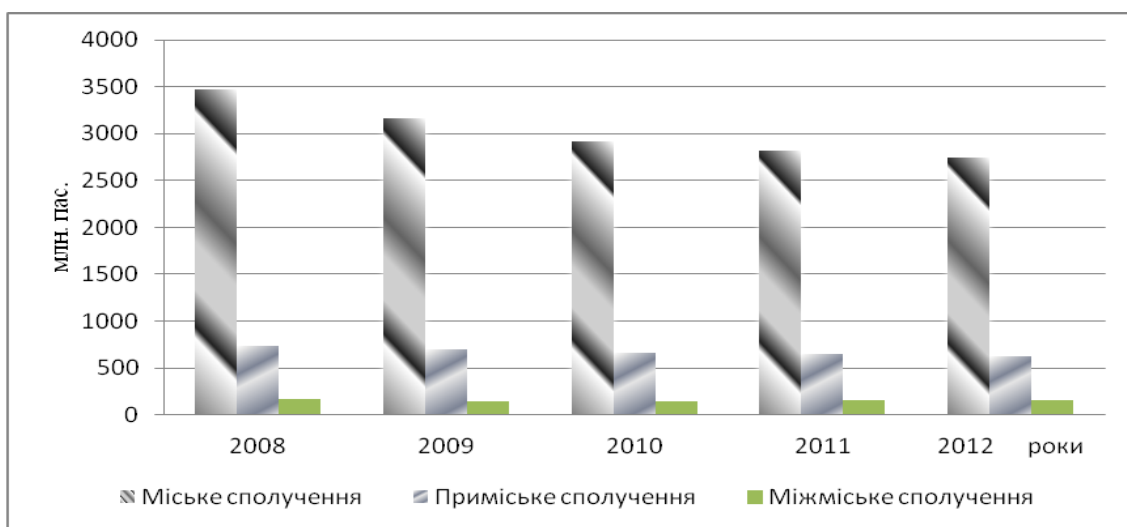
Рисунок 1. – Частка пасажирських перевезень за видами сполучень

Мета дослідження. Досягти ефективних результатів формування команд проектів побудови пасажирських маршрутних систем міст на основі використання елементів теорії управління проектами.