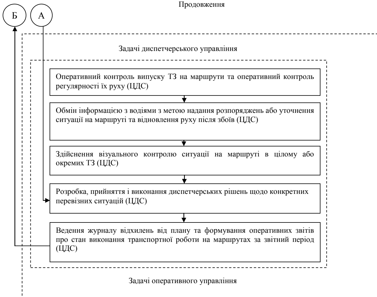
Рисунок 3. – Інформаційно-логістичний підхід щодо вирішення задач управління пасажирськими перевезеннями

Широке використання телекомунікаційних засобів для повсякденного перспективного, поточного та оперативного управління міськими автобусними перевезеннями вимагає техніко-економічного та інженерного обґрунтування послідовності виконання комплексу задач з прийняття технологічних та управлінських рішень, що представлено нами у викладі основного матеріалу.