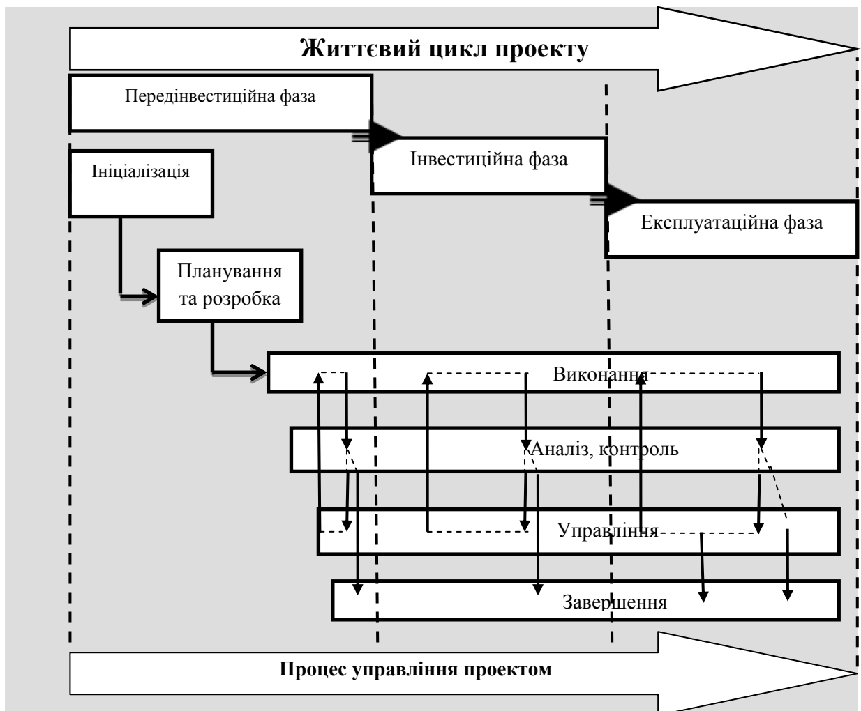
Рисунок 1. – Процес розвитку ЖЦП

Життєвий цикл (ЖЦ) складається з певних стадій розвитку проекту, які прийнято називати фазами. Фаза проекту - це окремий період часу в порядку проходження проекту, який принципово відокремлений від інших періодів. Вона виробляє як підсумковий продукт, так і рішення, які згодом стануть основою для наступної фази. Фази мають певні завдання і можуть мати встановлені терміни.