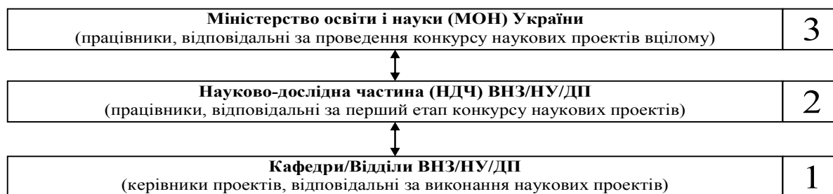
Рисунок 3 – Функціональна ієрархічна структура ІС НУ

Розглянемо детальніше запропоновану функціональну ієрархічну структуру ІС НУ (рис. 3).