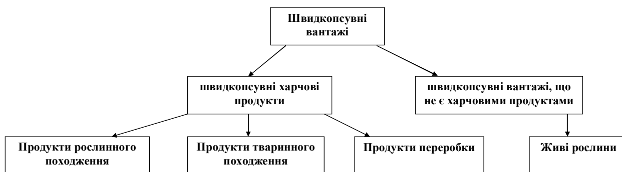
Рисунок 2 – Класифікація швидкокопсувних вантажів, що перевозяться у міжнародному сполученні (авторська розробка)

Нормативно-правові положення проекту Наказу «Правил перевезення швидкокопсувних вантажів автомобільними транспортними засобами» максимально наближені до міжнародних норм, а саме – Угоди про міжнародні перевезення швидкокопсувних харчових продуктів та про спеціальні транспортні засоби, які призначені для цих перевезень. Важливим нововведенням є поділ швидкокопсувних вантажів на швидкокопсувні харчові продукти та швидкокопсувні вантажі, що не є харчовими продуктами (рис. 2.).