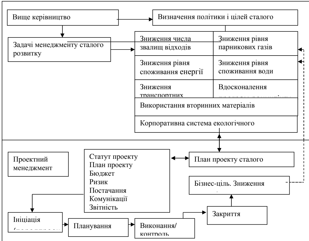
Рисунок 2 – Модель інтеграції УЕП

Теоретико-ігровий підхід до об'єднання двох методологій на базі дворівневої ієрархічної гри і пошуку стану ефективної рівноваги активної системи з розподілим контролем дозволив сформулювати модель інтеграції УЕП, яка представлена на рис. 2.