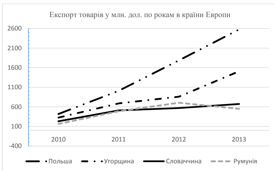
Рисунок 1 – Динаміка зміни експорту товарів із України в країни Європи

Враховуючи зростаючі товаропотоки на напрямку ЄС – Україна (див. рис. 1-3), а також той факт, що український ринок транспортно-логістичних послуг перебуває на стадії становлення, а логістична складова ТЛК тільки формується, виникає необхідність виявлення механізмів європейської транспортно-логістичної інтеграції та функціонування інтегрованого пан’європейського ТЛК, наукового обґрунтування і розробки шляхів інтеграції в неї України та розбудови, з урахуванням досвіду країн ЄС, ефективних національних ТЛК. Це сприятиме реалізації зовнішньоторговельних зв’язків України, її територіальному розвитку, залученню транзиту та збільшенню обсягів валютних надходжень, оптимізації товаропотоків, інтенсифікації господарських зв’язків з ЄС [4,5].