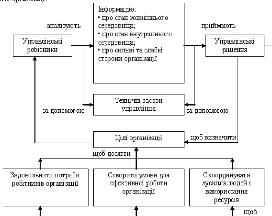
Рисунок 1. – Логіка процесу управлінської праці

Рис. 1 ілюструє логіку процесу управлінської праці і його цільову спрямованість на досягнення результатів організації.