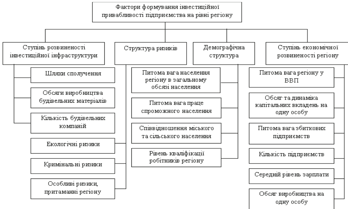
Рисунок 1. – Формування рівня інвестиційної привабливості підприємства на рівні регіону [5]

На рис. 1 наведені елементи, що формують їх інвестиційну привабливість. Слід відзначити, що значення окремих характеристик елементів, що підлягають розгляду, суттєво змінюються і є винятковими в залежності від досліджуваного об'єкту.