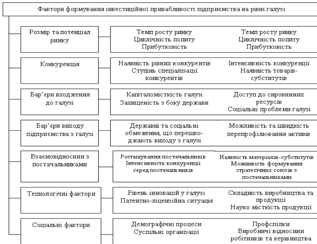
Рисунок 2.– Формування рівня інвестиційної привабливості підприємства на рівні галузі.