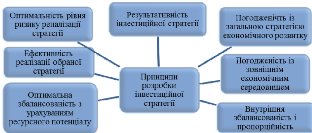
Рисунок 1. – Принципи розробки інвестиційної стратегії підприємства

Одним з індикаторів інвестиційної ситуації в транспортній системі є забезпеченість основним капіталом. Нормальне транспортне обслуговування економіки передбачає наявність засобів для розширеного відтворення, в той час як на сьогодні не вистачає ресурсів навіть для простого відтворення.