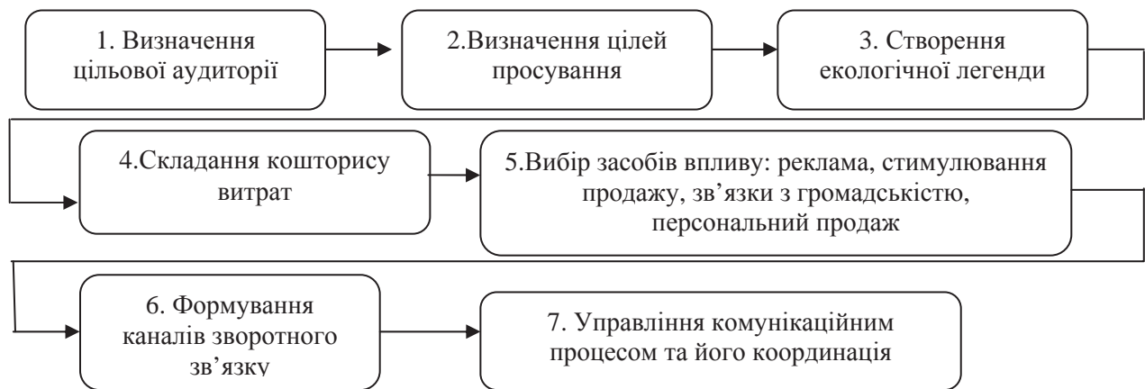
Рисунок 2. – Алгоритм просування екологічних товарів

Визначення цільової аудиторії означає виявлення потенційних і реальних покупців екологічного товару підприємства та осіб, які впливатимуть на рішення щодо їх купівлі.