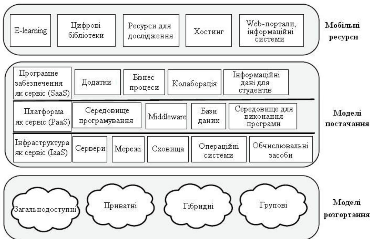
Рисунок 2 – Архітектура хмари для університетів

Моделі розгортання хмарної інфраструктури можуть бути у вигляді загальнодоступних, приватних, гібридних і групових хмар. В залежності від моделі постачання послуги можна використовувати можливості PaaS, IaaS, SaaS. Яку з категорій хмарного стека буде використовувати навчальний заклад, залежить від його потреб. Додатки, які використовує університет, вбудовуються в інфраструктуру хмарного провайдера. При цьому університету слід звертати увагу на стандартизацію і автоматизацію процедур розгортання й поновлення сервісу в інфраструктурі провайдера, а також враховувати процедури білінгу.