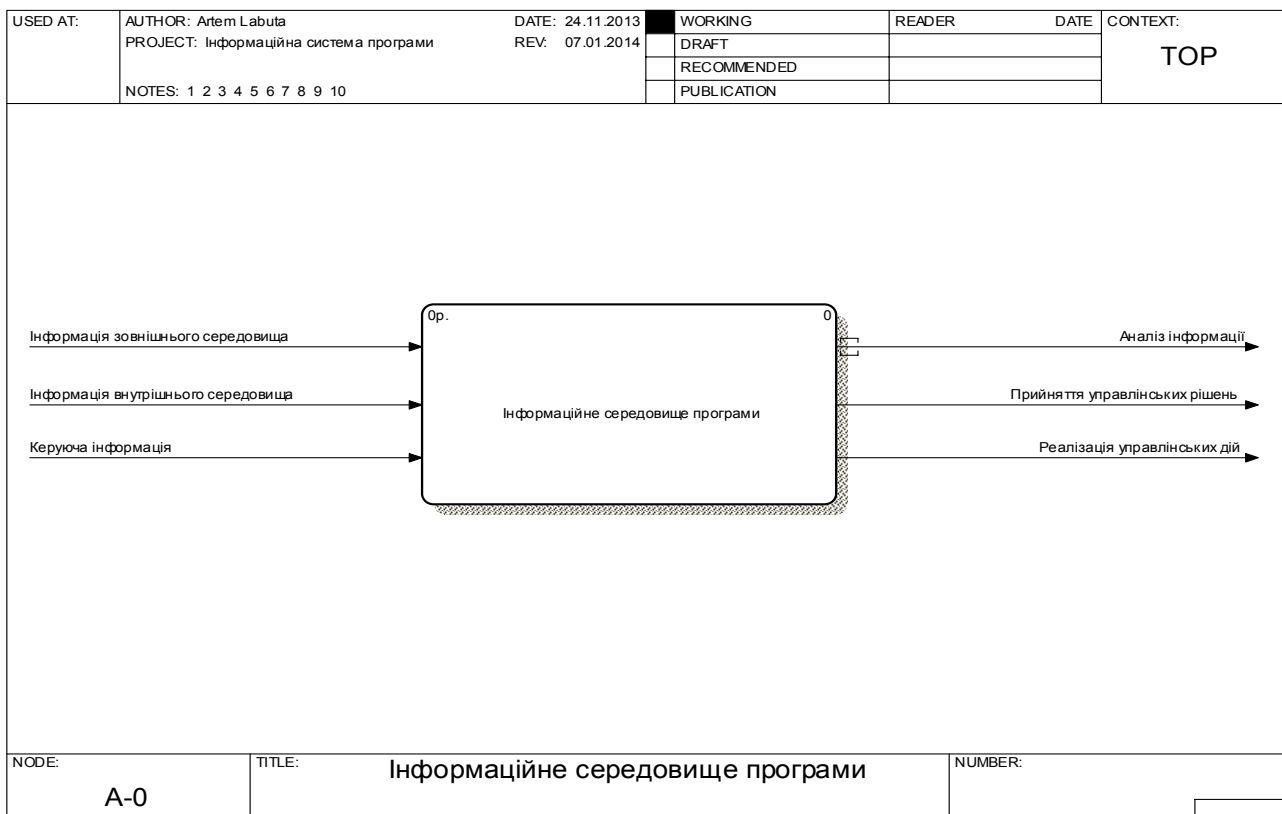
Рисунок 1 – Контекстна діаграма потоків даних інформаційної системи програми в нотатії DFD

Методологія діаграм потоків DFD моделює системи як взаємопов'язаний набір дій, які обробляють дані в "сховище" як усередині, так і поза межами модельованої системи. Діаграми потоків даних зазвичай застосовуються при моделюванні інформаційних систем [3]. DFD блоки – графічне зображення операції (процесу, функції, роботи) з обробки чи перетворення інформації, що відображає перетворення входів у виходи. DFD-блоки також мають входи і виходи, але не підтримують управління та механізми, як IDEF. Призначення даного моделювання полягає у візуалізації та оптимізації перетворення вхідних потоків у вихідні відповідно до описаного процесу (Рис. 1.).