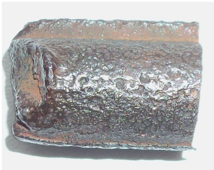
Рисунок 1. – Макрофотографія стержня, x4

На рис.1 показано фрагмент стержня арматури залізобетонного блоку марки «Вервольф». З мікрофотографії стержня видно, що поверхня останнього має «віспинки» діаметром 0,05-0,5 мм. Це свідчить про те, що стержень підпав, головним чином, під дію окислювального зношування, при якому головну роль відіграють хімічні реакції матеріалу з киснем повітря і окислювального середовища [5]. При цьому стержень практично не втратив поперечний розмір.