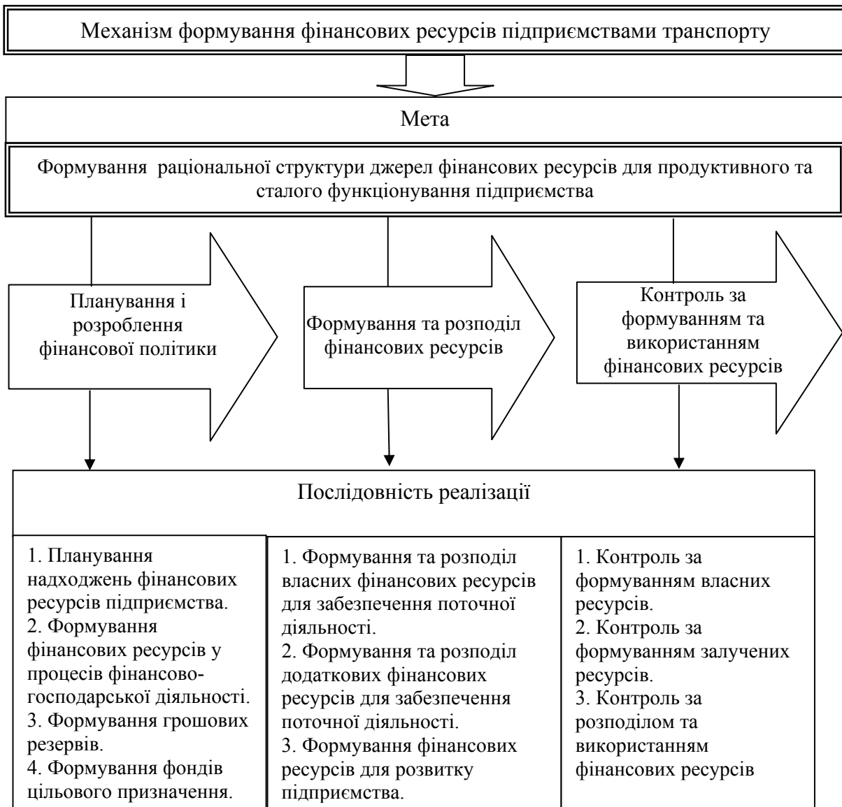
Рисунок 1 – Механізм формування фінансових ресурсів підприємствами транспорту

Важливим етапом у забезпеченні ефективності формування і використання фінансових ресурсів підприємства є створення ефективної системи контролю за дотриманням фінансової та платіжної дисципліни підприємства.