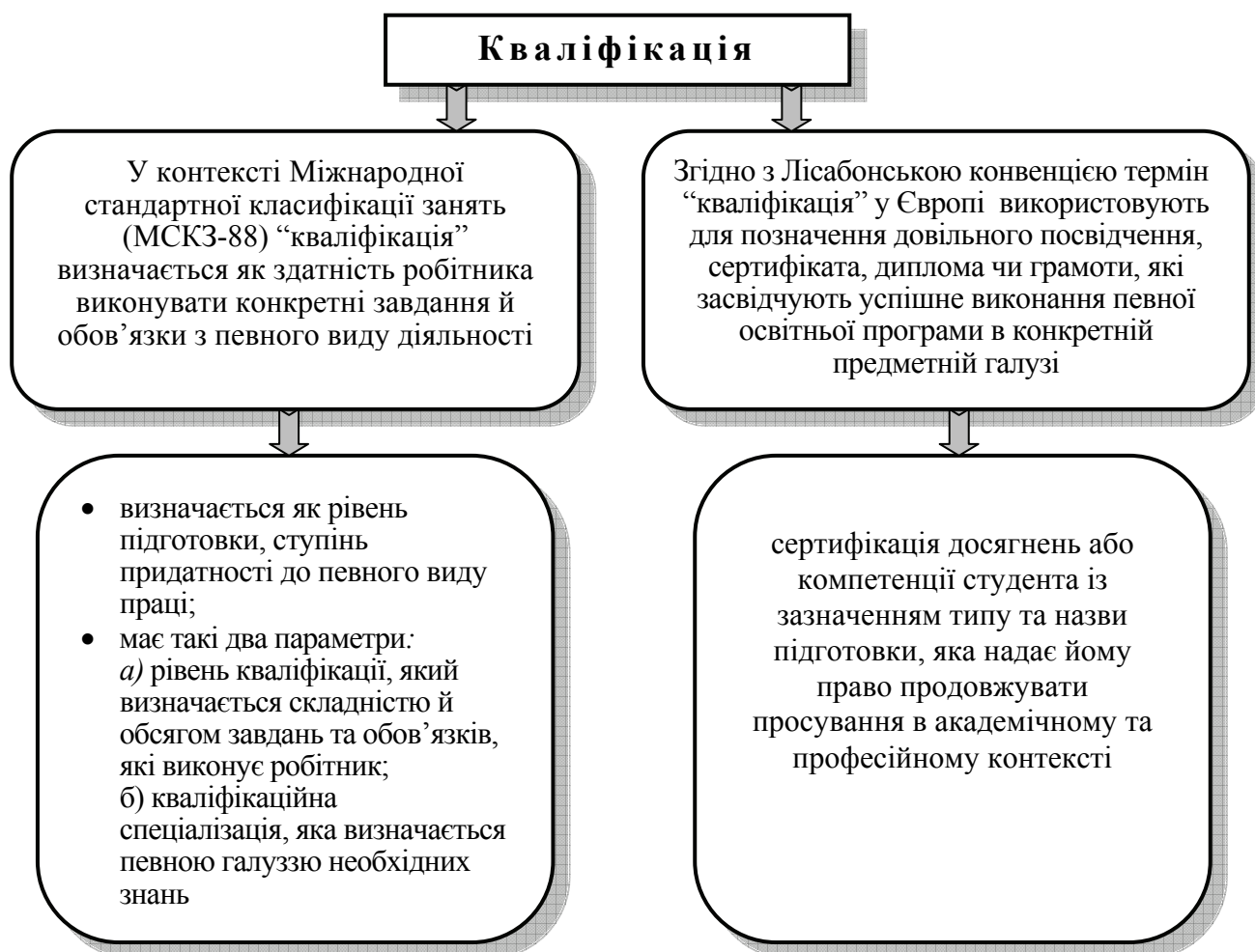
Рисунок 4 – Зміст поняття “кваліфікація”

Тут важливо уявити розбіжності між змістом поняття “кваліфікація”, наданого в контексті Міжнародної стандартної класифікації занять і Лісабонської Конвенції про визнання кваліфікацій (1997) (див. рис. 4).