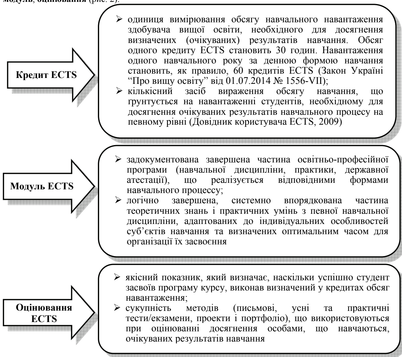
Рисунок 2 – Складові ECTS

Отже, як система організації навчального процесу ECTS вміщує основні три складові: кредит, модуль, оцінювання (рис. 2).