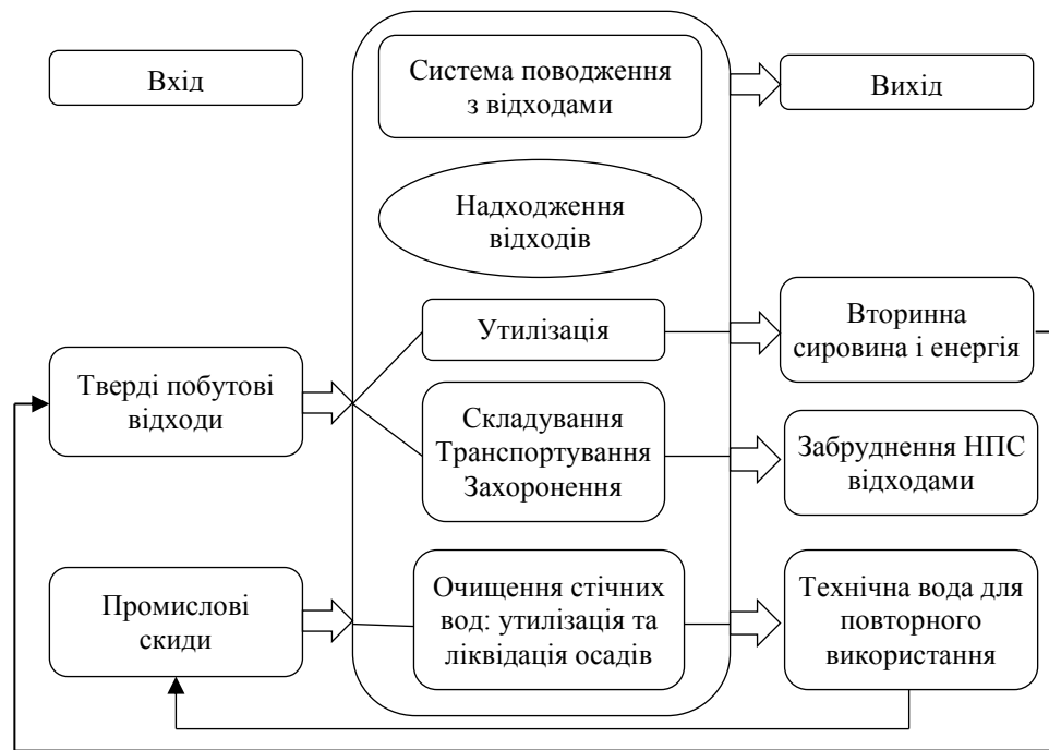
Рисунок 1 – Інвентаризаційний аналіз життєвого циклу промислових відходів

Також для оцінки системи поводження з відходами як інструмент екоменеджменту використовують метод мінімізації відходів виробництва [10], який можна розглядати як будь-яку діяльність, процес або ж метод, які унеможливають або зменшують обсяг викидів від джерел, або дають змогу впровадити повторне використання або перероблення відходів на самому об'єкті. Мінімізацію відходів виробництва розглядають як кращий підхід порівняно з принципом «кінця труби», тому що вона може як зменшити витрати на утилізацію відходів у промисловості, так і довкілля.