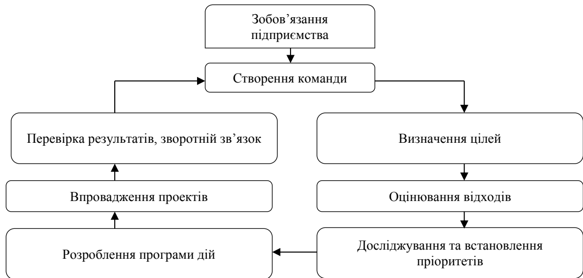
Рисунок 2 – Заходи щодо мінімізації утворення відходів

Відповідно до [9] ISO 14040 оцінка життєвого циклу відходів була проведена з чотирьох етапів: визначення цілей і сфери застосування, інвентаризаційний аналіз життєвого циклу, оцінка впливу протягом життєвого циклу та інтерпретація життєвого циклу.