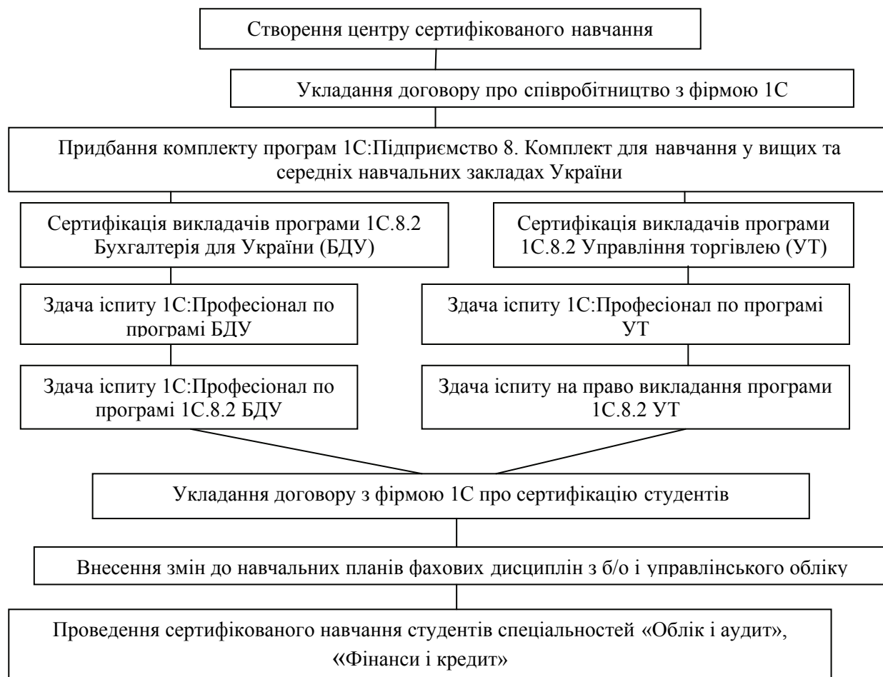
Рисунок 2 – Етапи створення ЦСН в НТУ