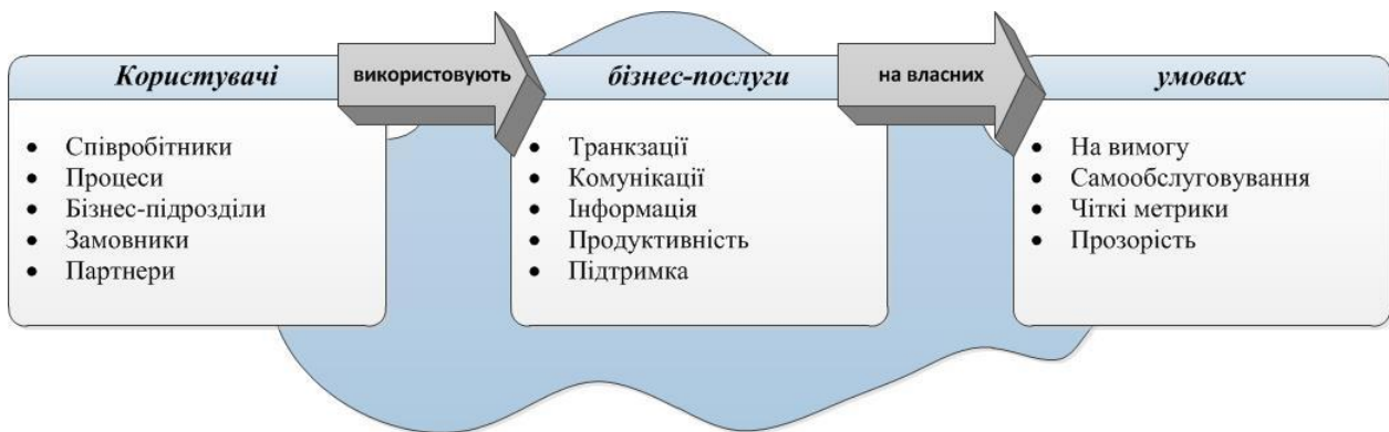
Рисунок 2 – «Хмара» з точки зору користувача [14]

За складом користувачів розрізняють: власні хмари підприємств (Private Cloud), хмари співтовариства (Community cloud), загальнодоступні хмари (Public cloud) та гібридні хмари (Hybrid Cloud).