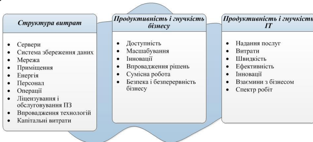
Рисунок 3 – Базові переваги хмарних обчислень [14]

Базові переваги для користувачів хмарних обчислень можна згрупувати за трьома категоріями: витрати; продуктивність і гнучкість бізнесу; продуктивність і гнучкість інформаційних технологій (рис. 3).