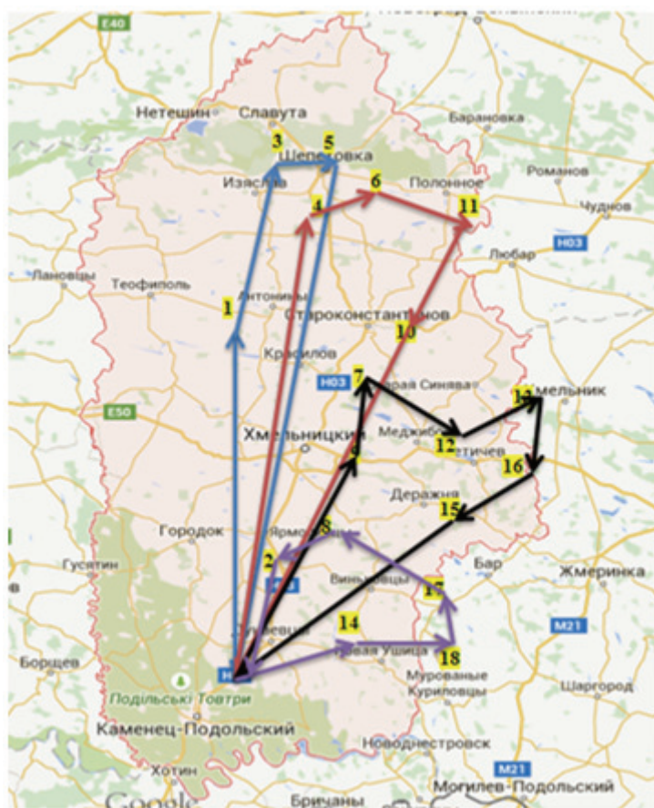
Рисунок 3 - Карта-схема розвізно-збірних маршрутів за алгоритмом Кларка-Райта

Висновки. Проведені розрахунки показали, що розробка розвізно-збірних маршрутів методом Кларка-Райта дозволяє отримати економічні та часові вигоди, а саме: зменшується собівартість перевезення за рахунок зменшення довжини їздки на 865,4 км., а час на виконання рейсів скоротиться на 15,05 години. Важливим фактором при такій маршрутизації є врахування завантаженості автомобіля, при якому буде можливим як довантаження, так і вивантаження вантажу. У подальших публікаціях будуть проведенні дослідження у цьому напрямку.