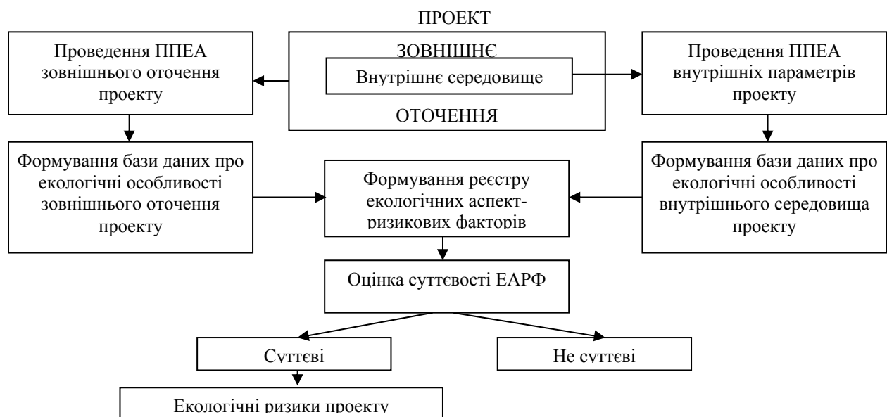
Рисунок 2 – Структурно-функціональні особливості підсистеми R^{EM}

Структурно-функціональні особливості підсистеми R^{EM} наведені на рис. 2.