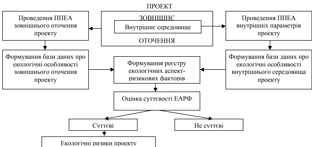
Рисунок 2 – Структурно-функціональні особливості підсистеми R^{EM}

Структурно-функціональні особливості підсистеми R^{EM} наведені на рис. 2.