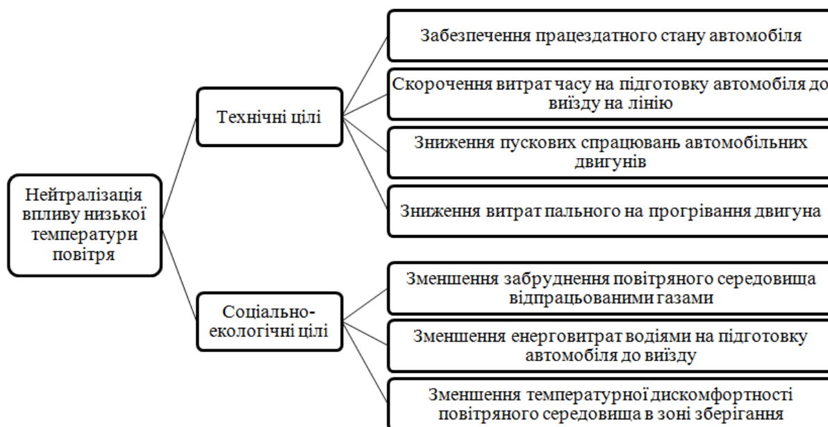
Рисунок 1 – Декомпозиція (дерево) цілей теплової підготовки двигуна

Взагалі, аналізуючи існуючі методи запобігання негативному впливу низької температури на агрегати автомобіля на початку його функціонування після тривалої стоянки, можна зробити висновок про те, що поряд із суто технічними, вони повинні вирішувати й соціально-екологічні задачі. Тому, декомпозицію цілей теплової підготовки двигуна, як категорії способів досягнення мети можна представити у наступному вигляді (рис. 1):