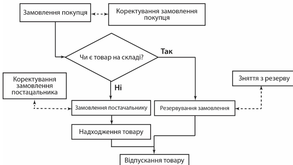
Рисунок 2 – Алгоритм типового бізнес-процесу продажу запасних частин через стіл замовлень

Програмний тренажер моделює алгоритм типового бізнес процесу продажу запасних частин через стіл замовлень (рис. 2) і представляє собою покрокову процедуру оформлення документів.