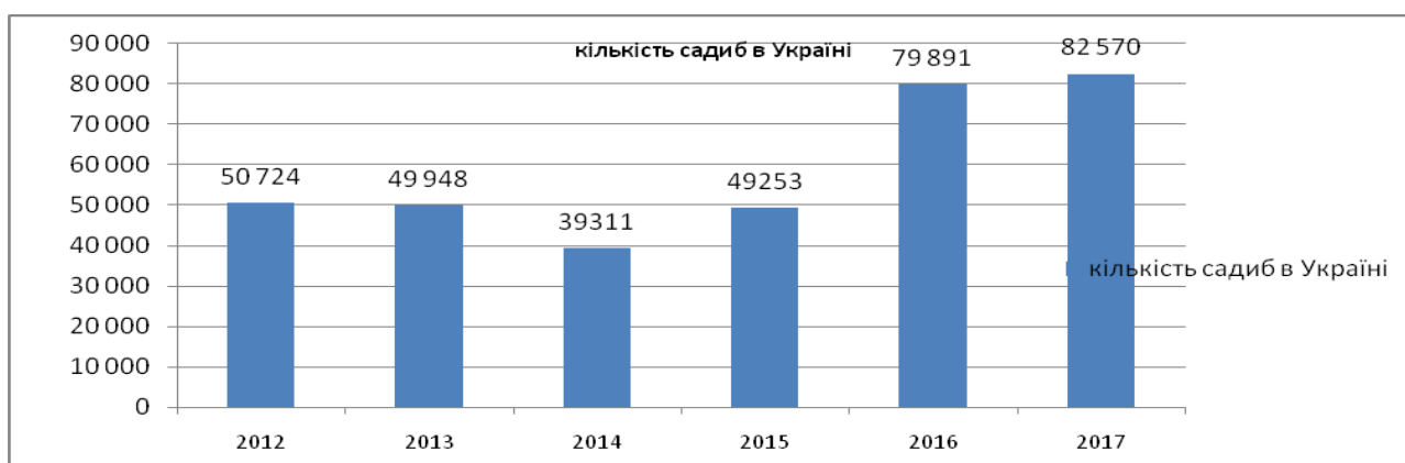
Рисунок 4 – Кількість екологічних садиб в Україні у 2012-2018 р. Figure 4 – Number of ecological estates in Ukraine in 2012-2018

В той же час, основними об'єктами екологічного туризму можна вважати садиби або агрооселі, що надають послуги з розміщення та харчування. І якщо проаналізувати їхню кількість, то можна зробити висновок, що вони позитивно зростають в останні роки, зокрема в 2018 р. їх кількість нараховувала 82570, що вдвічі більше за показник 2014 р.