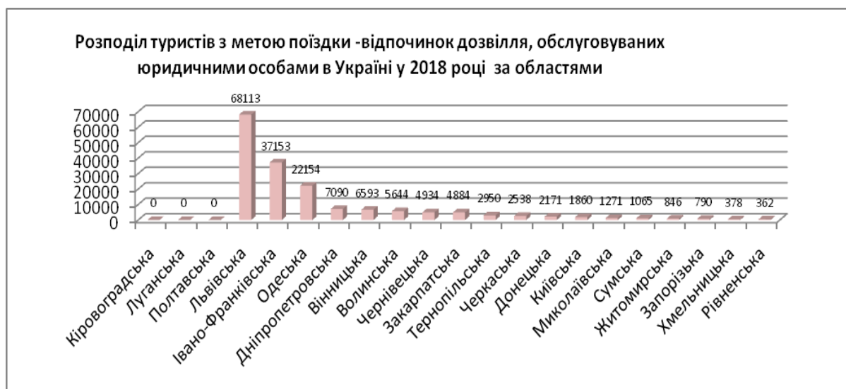
Рисунок 2 – Розподіл туристів з метою поїздки-відпочинок дозвілля, обслуговуваних юридичними особами в Україні у 2018 році за областями Figure 2 – Distribution of tourists by travel purposes – recreation and leisure services provided by legal entities in Ukraine in 2018 by region

Оскільки в Україні не збирається статистика із відвідування України з метою екологічного або сільського туризму, тому доцільно проаналізувати основні області та кількість туристів, що відвідали Україну.