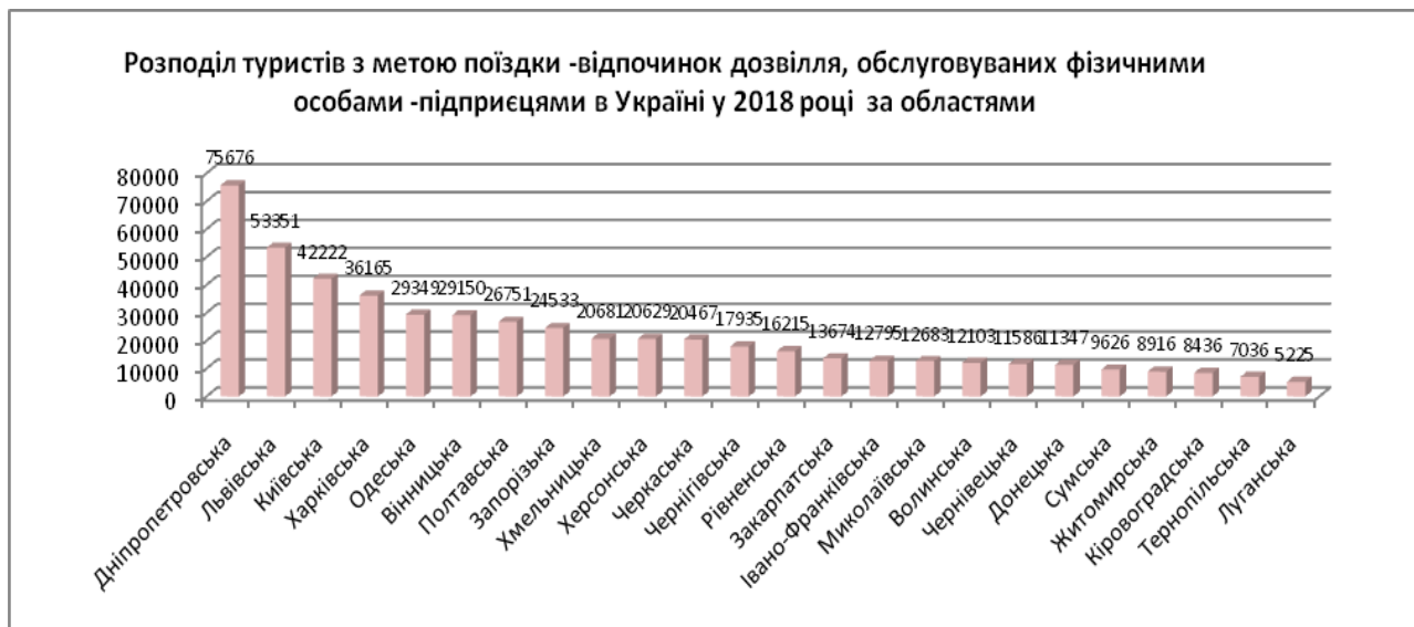
Рисунок 3 – Розподіл туристів з метою поїздки -відпочинок дозвілля, обслуговуваних фізичними-особами підприємцями в Україні у 2018 році за областями Figure 3 – Distribution of tourists who travelled with leisure purposes serviced by entrepreneurs in Ukraine in 2018 by Region

В той же час, розподіл туристів обслуговуваних фізичними-особами підприємцями у 2018 р. значно відрізнялась від обслуговування юридичними особами, і лідерами були, як видно з рисунку 3 – Дніпропетровська, Львівська, Київська, Харківська, Одеська області.