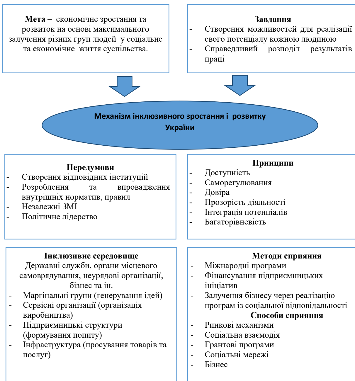
Рисунок 4 – Механізм інклюзивного зростання і розвитку України Figure 4 – Mechanism of inclusive growth and development of Ukraine

У результаті проведених аналітичних досліджень було розроблено механізм інклюзивного зростання і розвитку України, що базується на принципах, таких як: доступність, саморегулювання, довіра, прозорість, інтеграція потенціалів та захищеність (рис. 4).