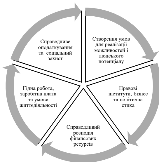
Рисунок 1 – Коло інклюзивного росту та розвитку Figure 1 – Circle of inclusive growth and development

Основними передумовами формування моделі інклюзивного росту та розвитку є п'ять складових [7], які формують коло інклюзивного розвитку, що представлено на рис.1.