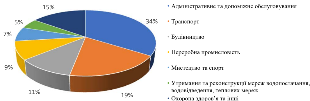
Рисунок 2 – Структура прийнятих рішень Антимонопольного комітету, що стосуються комунальних та державних підприємств, у 2020 році за класифікаторами видів економічної діяльності Figure 2 – Structure of the Antimonopoly committee decisions concerning communal and state enterprises in 2020 according to the types of economic activities classifiers

висока ймовірність недоотримання фінансових ресурсів з місцевого бюджету. Так, протягом 2020 року частка рішень Антимонопольного комітету щодо розвитку сфери транспорту складала 19% (рис.2) [12].