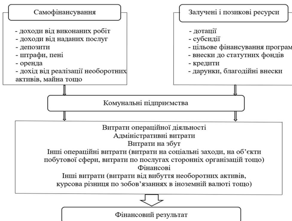
Рисунок 1 – Формування доходів та витрат комунальних підприємств Figure 1 – Formation of revenues and expenses of communal enterprises

Але сучасні реалії в комунальному секторі свідчать, що на сьогодні джерелом поповнення власного капіталу комунальних підприємств є переважно бюджетні асигнування, а не чистий прибуток, як це має бути у підприємства, що функціонує на конкурентному ринку [11]. Комунальні підприємства часто діють неефективно, оскільки, на відміну від приватних, не бояться банкрутства чи конкуренції у зв'язку з тим, що перебуваючи у комунальній власності завжди можуть розраховувати на підтримку власника (громади), який може поповнити капітал комунального підприємства з місцевого бюджету (рис.1).