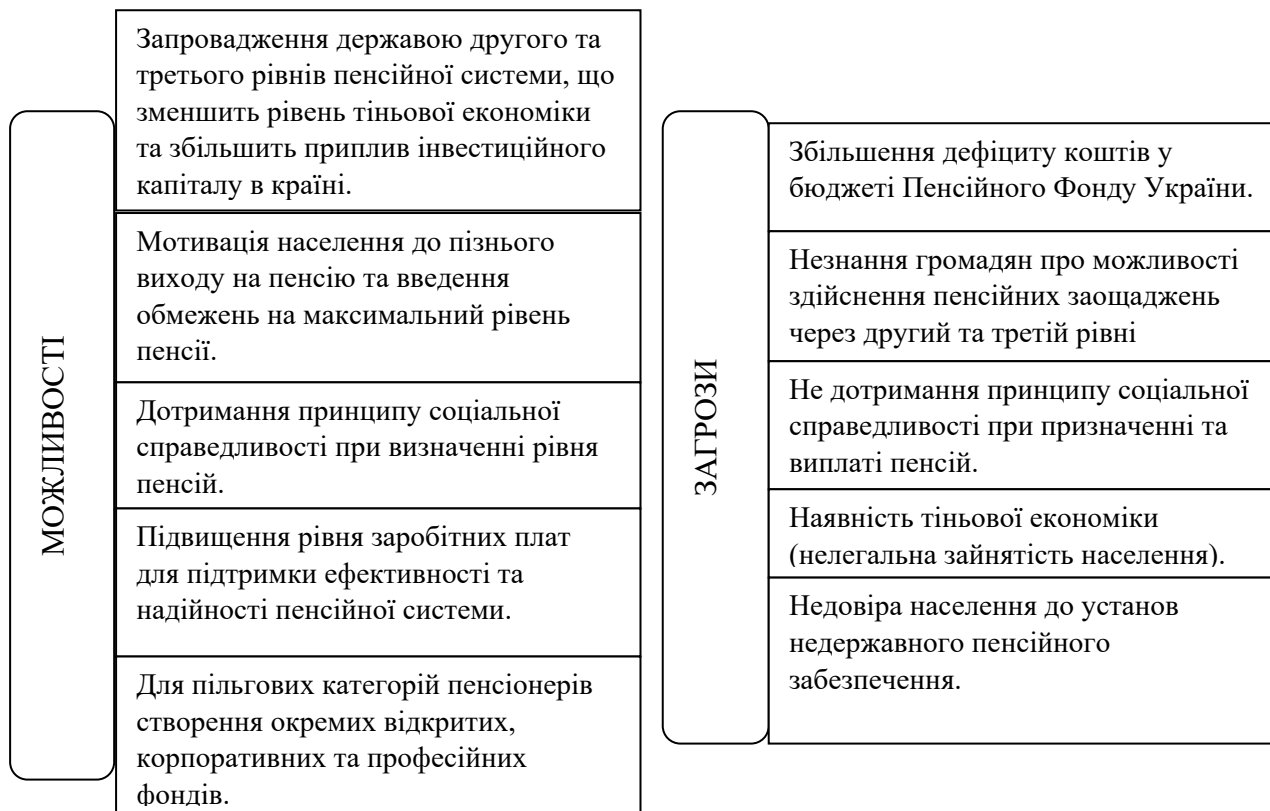
Рисунок 2 – Аналіз можливостей та загроз пенсійної системи України Figure 2 – Analysis of opportunities and threats of the pension system of Ukraine

До основних проблем, які постають перед недержавними пенсійними фондами при залученні фінансових ресурсів, що є необхідними для провадження їх діяльності, належать: