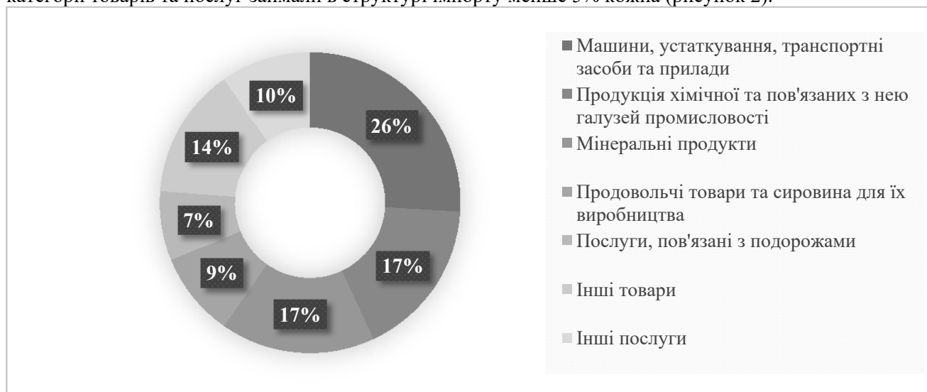
Рисунок 2 – Структура імпорту товарів та послуг України в 2021 році [Розроблено на основі джерел 2 та 3]

Найбільше в 2021 році Україною було імпортовано машин, устаткування та транспортних засобів (21,84 млрд дол. США). Досить значними в структурі імпорту були частки продукції хімічної промисловості (14,39 млрд дол. США) та мінеральних продуктів (14 млрд дол. США). На продовольчі товари припадало майже 10% українського імпорту (7,67 млрд дол. США). З послуг найбільше Україною імпортувалися послуги, пов'язані з подорожами (6, 25 млрд дол. США). Інші категорії товарів та послуг займали в структурі імпорту менше 5% кожна (рисунок 2).