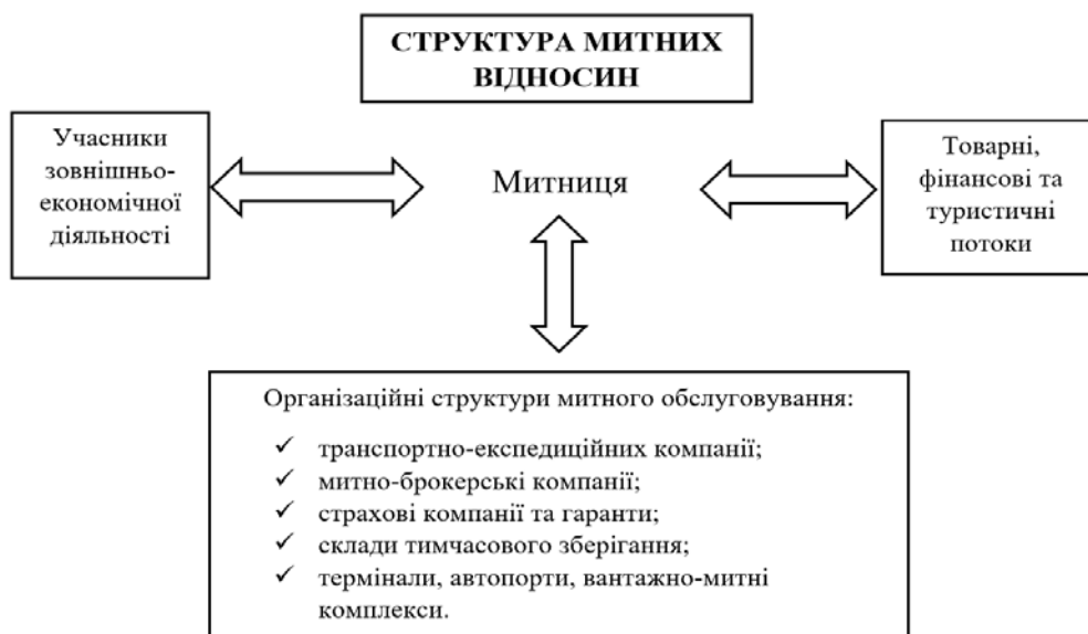
Рисунок 1 – Умовна схема структури митного обслуговування Figure 1 – Conventional scheme of the customs service structure

Виклад основного матеріалу. Процес митного обслуговування ґрунтується на взаємодії суб'єктів різних рівнів (вітчизняних та зарубіжних суб'єктів господарювання, національних та іноземних митних органів, митних посередників, міжнародних організацій, тощо). Для того щоб митна служба могла ефективно здійснювати свої функції в системі зовнішньоекономічної діяльності та митному обслуговуванні їй необхідний певний фундамент у вигляді матеріальної бази, обладнання, офісних приміщень, інформаційні системи, транспортно-експедиційних компаній, митно-брокерських компаній, страхових компаній та гарантів, складів тимчасового зберігання, терміналів, автопортів та вантажно-митних комплексів, вся сукупність матеріальних об'єктів, державних і ринкових структур, система забезпечення діяльності митних органів, називається структурою митного обслуговування (рис.1).