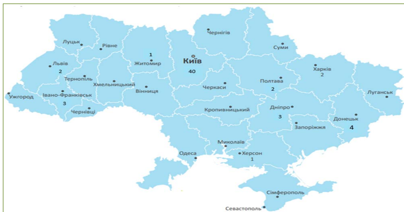
Рисунок 1 – Територіальний розподіл недержавних пенсійних фондів Figure 1 – Territorial distribution of non-state pension funds

Територіальний розподіл недержавних пенсійних фондів представлено на рис.1 [6].